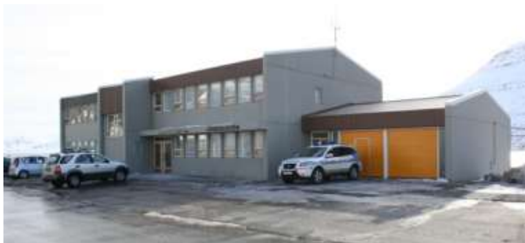
Lögglustöð á Eskifirði

Umdæmi lögreglustjórans á Austurlandi spannar landssvæði úr norðri frá mörkum Langesbyggðar, Vopnafjarðarhrepps og Norðurþings. Í suðri að mörkum sveitarfélagsins Hornafjarðar og Djúpavogshrepps. Umdæmið nær yfir 14.800 km 2 landsvæði, auk hluta Vatnajökuls.